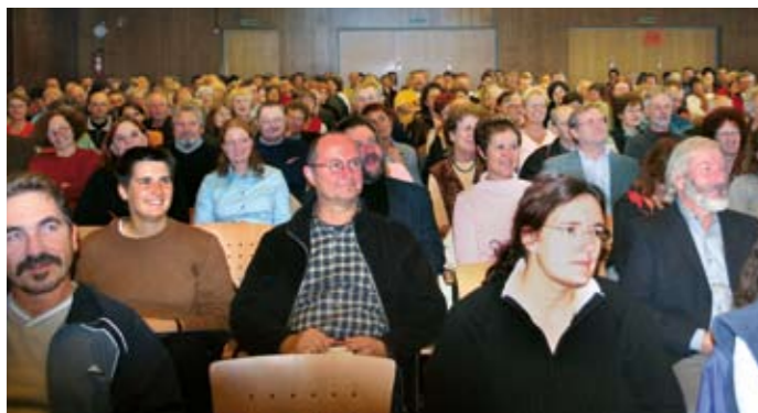
Einer der VBE-Lehrertage