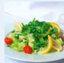
Salat, Salatteller, Zitronen, Tomaten u. Ä.