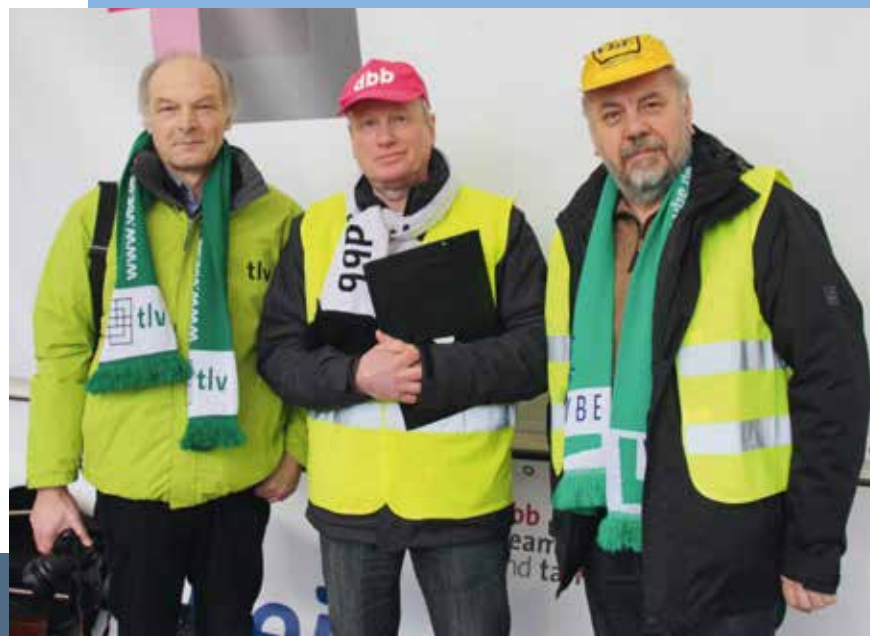
Gemeinsamer Warnstreik von Sachsen, Sachsen-Anhalt und Thüringen am 24.03.2015 in Leipzig

Auch in den Schulen begann dann die „heiße Phase“ der Wendezeit. Unsere Vorgesetzten und auch unsere Gewerkschaft verfielen in eine Art „Tiefschlaf“. Und plötzlich waren wir allein und mussten uns selbst helfen, damit in den Schulen wenigstens der Unterricht einigermaßen vorstättenging. In dieser Zeit fanden auch einige Veranstaltungen statt, wo es um die zukünftige Bildung ging. Als Lehrer wurden wir oft angegriffen und einige sahen in uns die Schuldigen. Für einige waren wir die, die das System stützten, und für andere die, die zum Sturz beigetragen haben. Es war eine schwierige Zeit. Ich kann mich noch an eine Veranstaltung in der Turnhalle unserer Berufsschule