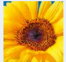
Sonnenblume, gelbe Blüten, Sommerblume, Gartenblume u. Ä.