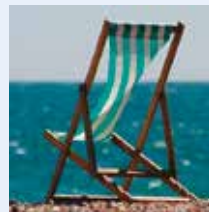
Liegestuhl, Meer, Sand, Strand u. Ä.