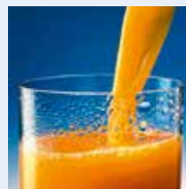
Glas Saft, Orangensaft, Fruchtsaft, Saftglas u. Ä.