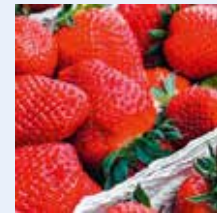
Erdbeeren, Erdbeere, Erdbeerschale, Früchte u. Ä.