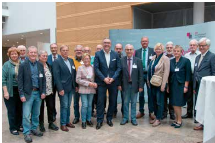
Mitglieder der Hauptversammlung der dbb bundesseniorenvertretung