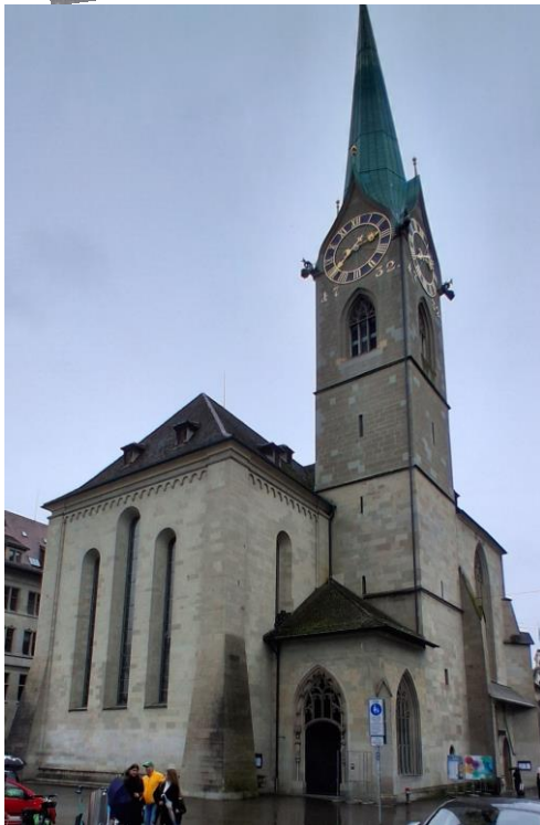
St. Peter mit dem größten Ziffernblatt Europas Durchmesser 8,7 Meter